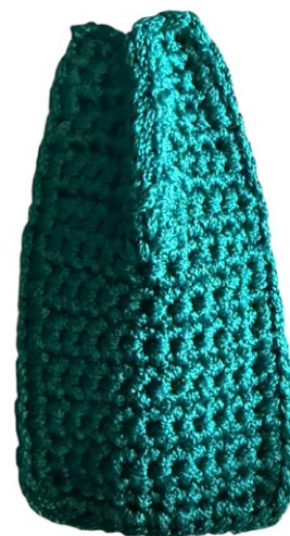
Unire le due punte insieme di ogni laterali