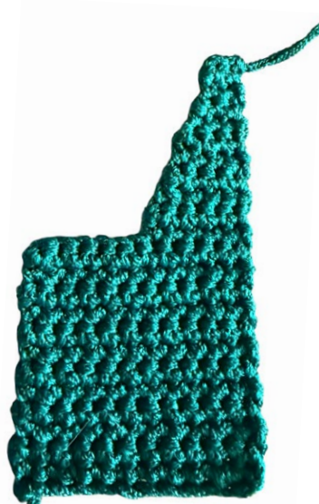
Laterale con una punta

Unire le due punte insieme cucendole con ago tirafettuccia ed eliminare lo spazio vuoto tra le punte. Realizzare due laterali.