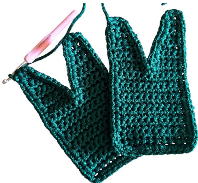
Laterali ompleti con due punte