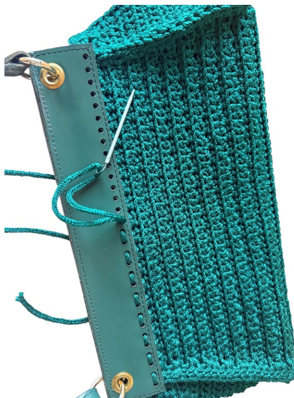
Cucire la patella